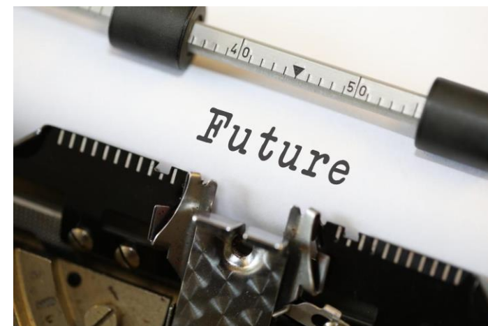
Nick Youngson CC BY-SA 3.0 ImageCreator